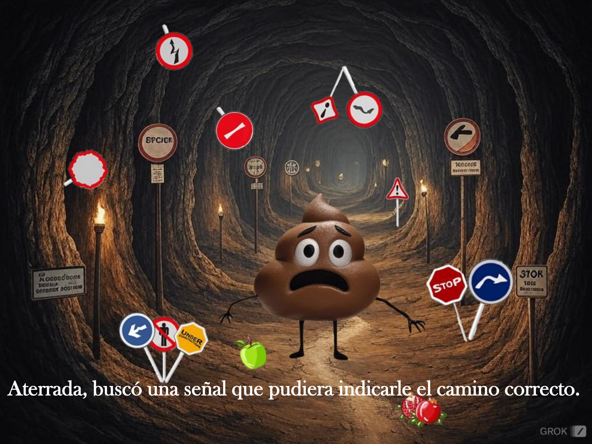
Aterrada, buscó una señal que pudiera indicarle el camino correcto.